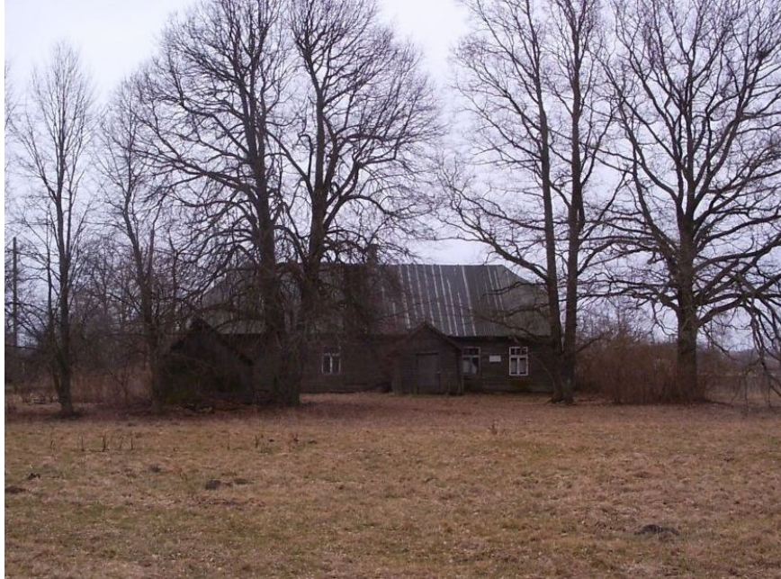
Joonis 4: Sõõro külakool 2008.aastal.

on kompleksi terviklikkuse seisukohast olulise hoonega (sh on puukuuri olemasolu tähtis kompleksi kaugvaadetes), siis on puukuur arvatud restaureeritavate objektide nimistusse. Korrastamist vajab veel ka massiivse pumbapalgi ja veepumbaga kaev, mis on samuti ajale alla andmas ning nii kaevuraketis kui kahjustatud pumbapalk vajavad restaureerimist. Täiesti on hävinenud kuivkäimla, mis tuleb ehitada uuesti.