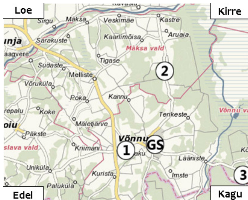
Joonis 7. Võimalikud ligipääsuteed planeeritavale G. Suitsu majamuuseumile (nr 1 – ligipääs Tartu – Rõpina maanteelt; nr 2 – ligipääs läbi Kavastu, Mäksa ja Kastre; nr 3 – Hammaste – Rasina maantee)

Emajõe Suursoo kaitseala , mis on Eesti suurim deltasoostik. Alljärgneval kaardil on välja toodud piirkonna täpsem teedevõrk ja võimalikud ligipääsuteed.