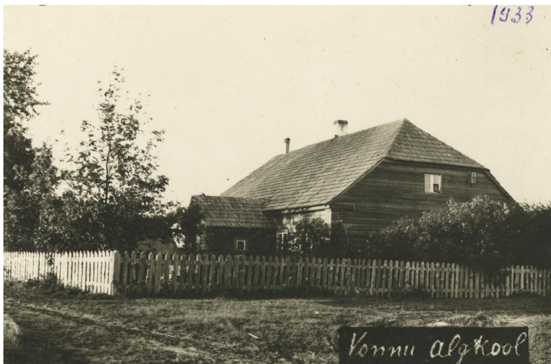
Joonis 3. Vaade koolimajale idast 1933. aastal (Allikas: Muinsuskaitse eritingimused).

Praegusel hetkel on ajalooline koolihoone keskmise suurusega ühekorruseline poolkelpkatusega rõhtpalkehitis. Hoone osad on kaetud rõhtlaudvoodriga, kusjuures ehitise mõlemad ehitusjärgud on selgesti eristatavad erineva laudise ja kujunduselementidega. Hetkel on laudis vana, kulunud ja vajab osaliselt väljavahetamist. Hoone paikneb madalal, sideaineta laotud maakivivundamendil. Hoonel on säilinud ajalooline laastukatus, mis hilisemalt on kaetud ruberoidkattega. Maja aknad on kahe poolega ning topeltraamidega, ülaosas kolmeks või neljaks jaotatud aknad. Samuti on hoonel telliskorsten ja tellistest soemüür hoone keskteljel. Klassitoas on säilinud 1930. aastatest pärinev lihtpottahi, elutubades ümara kestaga raudahi ja 60-datest pärinev lihtpottahi.