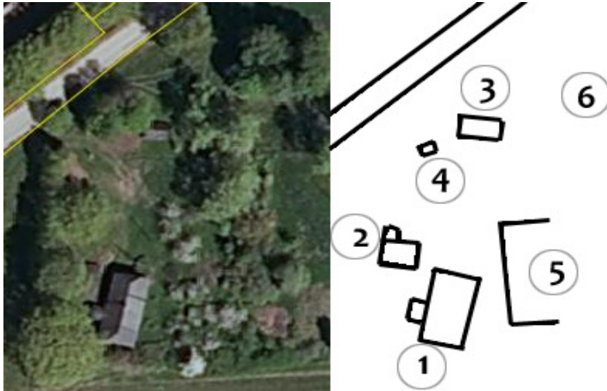
Joonis 5. Rajatiste paiknemine kinnistul (1-endine koolihoone; 2-kuur; 3-saunamaja; 4-kaev, 5- kõrvalhoone vareded; 6-sünnikoht)