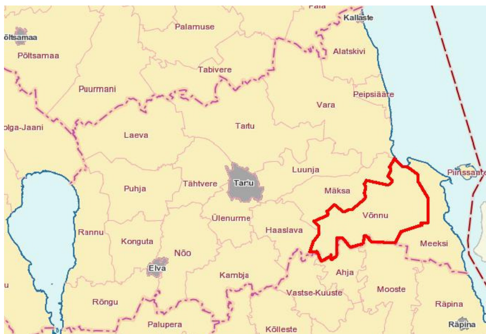
Joonis 1: Tartumaa haldusjaotus (Allikas: Maa-ameti kaardiserver ( www.maaamet.ee )).

Kavandatav G. Suitsu majamuuseum asub Võnnu külas, Võnnu vallas Tartumaal. Võnnu vald paikneb Tartumaa idaosas, jäädes Tartu linnast samuti idapoole. Omavalitsus piirneb põhjast Mäksa vallaga, lõunast Ahja, Vastse-Kuuste ja Mooste valdadega (Põlvamaa omavalitsused), läänest Haaslava vallaga ning idast Meeksi vallaga. Valla üldpindala on kokku 229 km 2 .