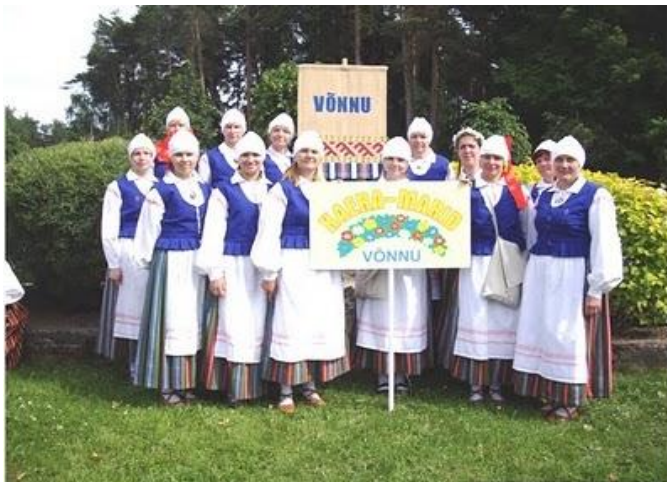
Võnnu rahvatantsurühm „Kaera-Marid“

Pidu tuleb. Kokku on registreerinud üle Eestimaa 253 tantsurühma 3122 tantsijaga. Esindatud on kõik maakonnad, soovijaid on ka Rootsist, Leedust ja Ameerikast.