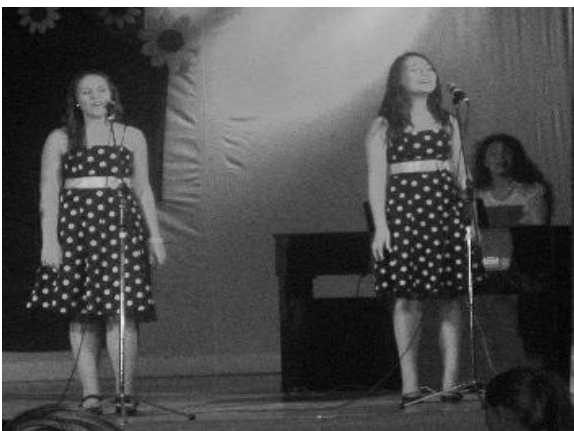
Läti tüdrukud laulmas eesti keeles „Saaremaa valssi“

7. veebruaril laulsid Võnnu kultuurimajas Hispaania, Portugali, Itaalia ja Läti noored koos võnnukatega. Toimus Võnnu Keskkooli Comenius projekt „Muusika ühendab inimesi“.