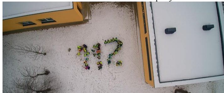
Foto drooniga filmitud lõigust (Marek Saarepera) monteeritud foto (Toomas Burm).

Filmilõiku on võimalik näha Võnnu Vabatahtlike Päästeseltsi Facebooki lehel