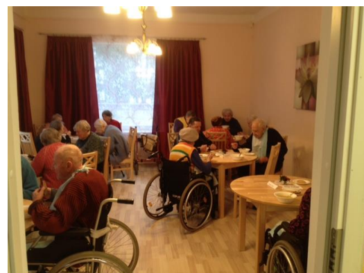
Võnnu Kodu uus söögi-saal

Hooldekodu juhtkond avaldab tänu Võnnu Vallavalitsusele, kelle