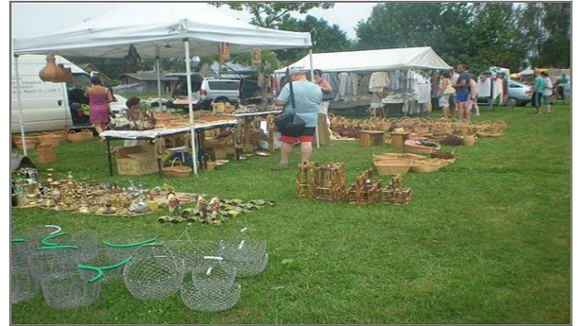
Võnnu väljanäitus-laad müügiplats

Soovijatele pakkusime tasuta laadasuppi. Ei