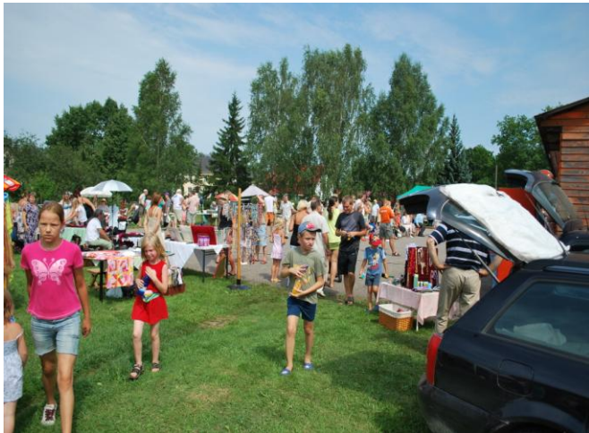
Võnnu väljanäitus-laad 25.juulil 2010.a.