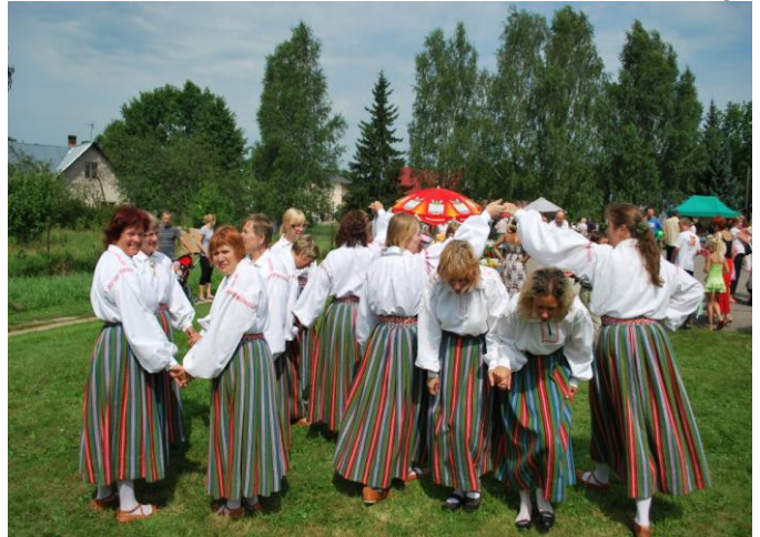
Võnnu rahvatantsurühm „Kaera-Marid“ laadamelus