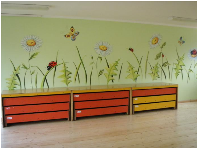
Lasteaed pärast remonti