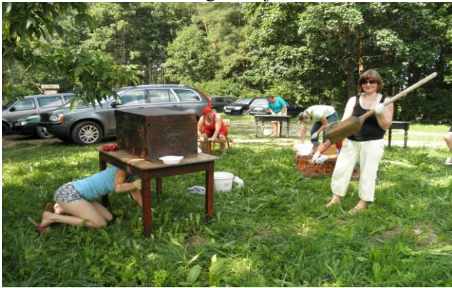
Restaureerimisalane õpituba Läänistes

Muuseumiekspositsioon „Puust sündinud elu” andis huvitava võimaluse tutvuda kohaliku ajaloo ja elu-oluga. Külastasime ka Avinurme kirikut. Puutööalases õpitoas valmistasime kogenud meistri näpunäiteid järgides igaüks endale väikese laastukorvi. Lahke vastuvõtt Avinurmes ning saadud kogemused tegid väljasõidu meeldivaks ning saime ka innustust oma tegevuse jätkamiseks.