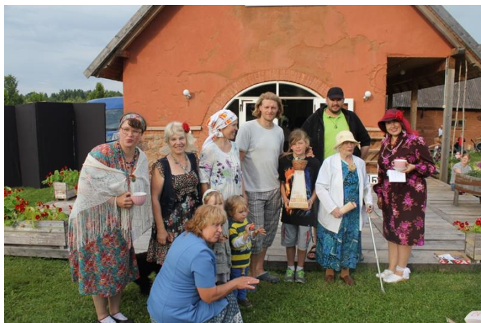
Pildil: Külavõistluse võitjad - Kurista küla võistkond

Vana-Tamme talus tutvuti loomadega. Neid oli seal palju erinevaid: väikeseid ja suuri, valgeid ja musti, vabalt ringi jooksvaid ja aedikus käivaid. Kõige eksootilisemad olid nutriad ja ringkäigul nime saanud elevantjäned. Selles talus olid kõik pereliikmed